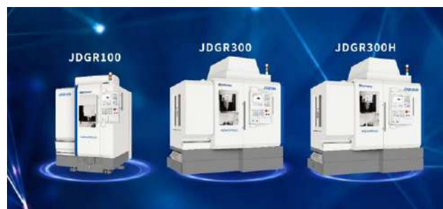
三款新机型，五轴新体验

精雕将在本届展会上全新发布三款应用于各个行业的五轴高速加工中心，同时，精雕五轴高速机大家族系列也是首次亮相；