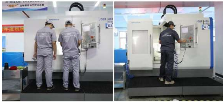
2019 机械行业职业教育技能大赛——“精雕杯”五轴数控加工技术大赛 全国各地年轻高技能人才精彩较量